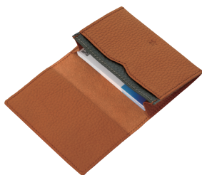
●使用イメージ 名刺約30枚入ります